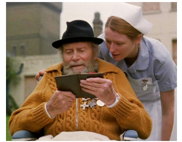
1989 WAR REQUIEM (War Requiem) de Derek Jarman avec Laurence Olivier