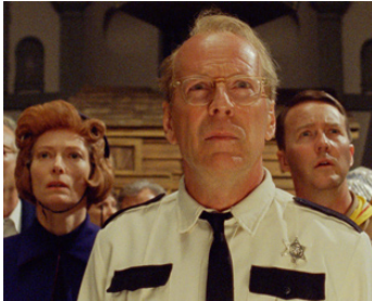
2012 MOONRISE KINGDOM de Wes Anderson avec Bruce Willis, Edward Norton