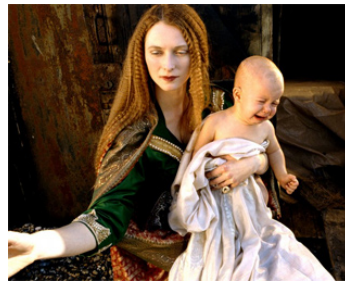
1988 THE LAST OF ENGLAND (The Last of England) de Derek Jarman