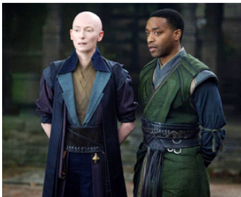
2016 DOCTOR STRANGE (Doctor Strange) de Scott Derrickson avec Chiwetel Ejiofor