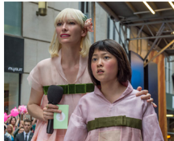
2017 OKJA (Okja) de Bong Joon-Ho avec Ahn Seo-Hyun