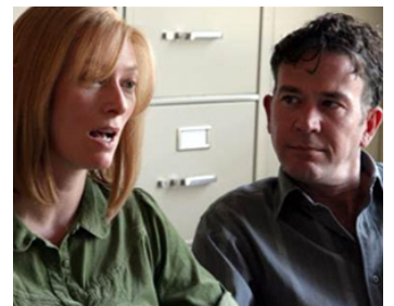
2006 STEPHANIE DALEY d'Hilary Brougher avec Timothy Hutton