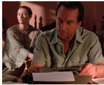
1987 FRIENDSHIP'S DEATH de Peter Wollen avec Bill Paterson