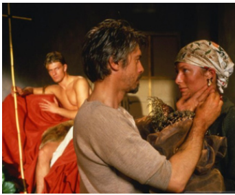
1986 CARAVAGGIO (Caravaggio) de Derek Jarman avec Sean Bean, Nigel Terry