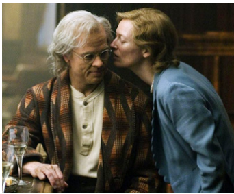
2008 L'ÉTRANGE HISTOIRE DE BENJAMIN BUTTON de David Fincher avec Brad Pitt