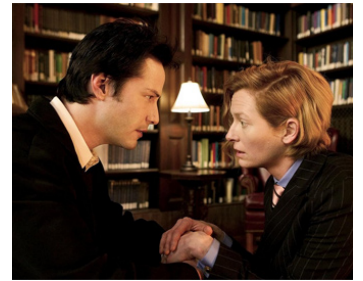
2005 CONSTANTINE (Constantine) de Francis Lawrence avec Keanu Reeves