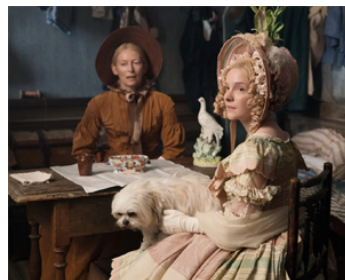
2019 THE PERSONAL HISTORY OF DAVID COPPERFIELD d'A. Ianucci avec Morfydd Clark