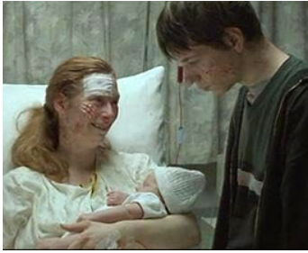
1999 THE WAR ZONE (The War Zone) de Tim Roth avec Freddie Cunliffe