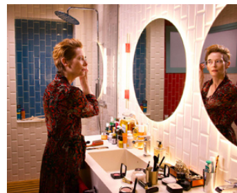
2020 LA VOIX HUMAINE (La Voz humana) de Pedro Almodovar