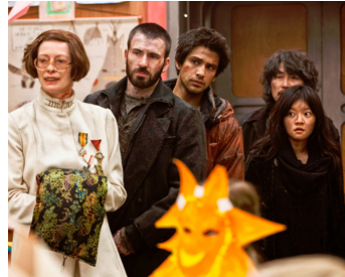
2013 SNOWPIERCER, LE TRANSPERCENEIGE de Boon Joon-Ho avec L. Pasqualino, Ch. Evans