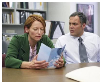
2005 ÂGE DIFFICILE OBSCUR (Thumbsucker) de Mike Mills avec Vincent D'Onofrio