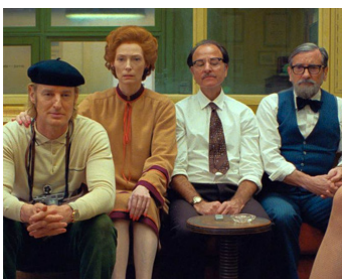
2021 THE FRENCH DISPATCH de Wes Anderson avec Owen Wilson, Fisher Steven, Griffin Dunne