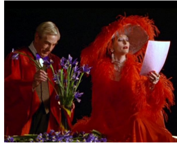
1993 WITTGENSTEIN (Wittgenstein) de Derek Jarman avec Michael Gough