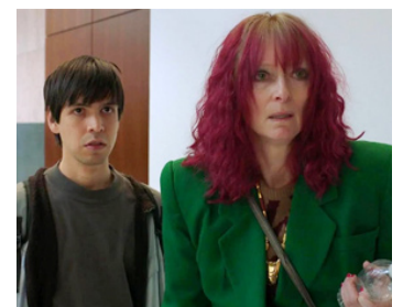
2023 PROBLEMISTA (Problemista) de Julio Torres avec Julio Torres