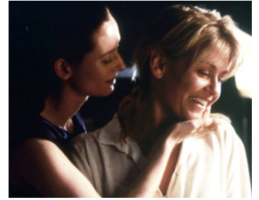
1996 FEMALE PERVERSIONS de Susan Streitferd avec Amy Madigan