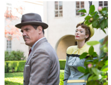
2016 AVE, CÉSAR (Hail, Caesar !) de Joel et Ethan Coen avec Josh Brolin