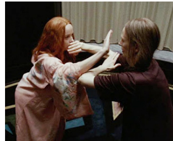
2018 SUSPIRIA (Suspiria) de Luca Guadagnino avec Dakota Johnson