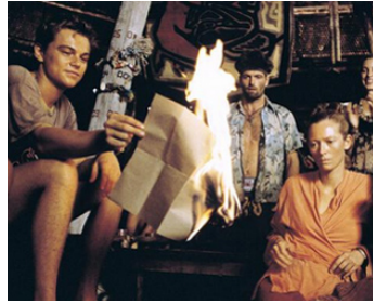
2000 LA PLAGES (The Beach) de Danny Boyle avec Leonardo DiCaprio