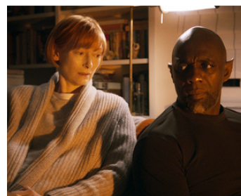
2022 3000 ANS À T'ATTENDRE (3000 Years of Longing) de George Miller avec Idris Elba