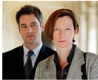
2003 CRIME CONTRE L'HUMANITÉ (The Statement) de Norman Jewison avec Jeremy Northam