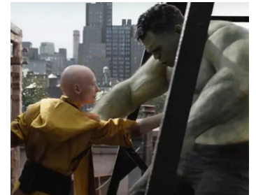
2019 AVENGERS: ENDGAME d'Anthony et Joe Russo avec Mark Ruffalo