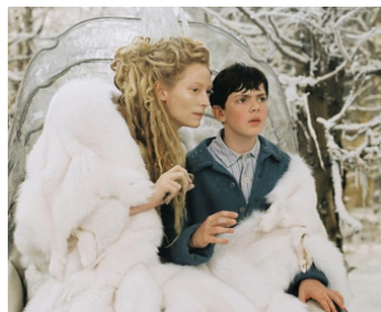
2005 LE MONDE DE NARNIA (The Chronicles of Narnia) d'Andrew Adamson avec Skandar Keynes