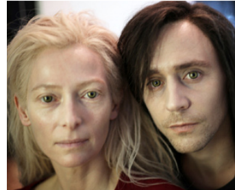
2013 ONLY LOVERS LEFT ALIVE de Jim Jarmush avec Tom Hiddleston