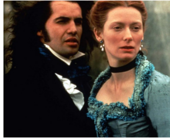
1992 ORLANDO (Orlando) de Sally Potter avec Billy Zane