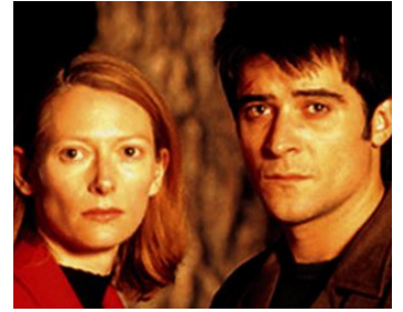
2001 BLEU PROFOND (The Deep End) de Scott McGehee & David Siegel avec Goran Visnjic