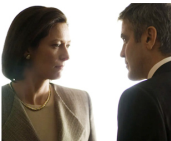
2007 MICHAEL CLAYTON (Michael Clayton) de Tony Gilroy avec George Clooney