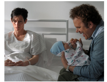
2011 WE NEED TO TALK ABOUT KEVIN de Lynne Ramsay avec J. C. Reilly