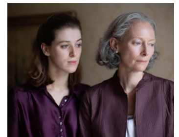
2020 THE SOUVENIR PART II de Joanna Hogg avec Honor Swinton Byrne