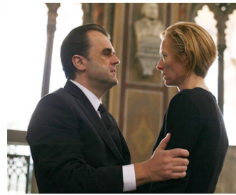
2009 AMORE (Amore) de Luca Guadagnino avec Pippo Delbono