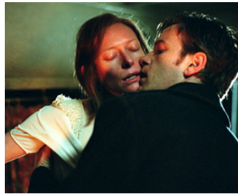
2002 YOUNG ADAM de David Mackenzie avec Ewan McGregor