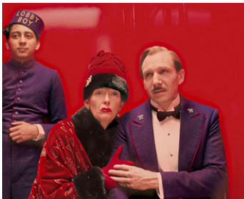
2014 THE GRAND BUDAPEST HOTEL de Wes Anderson avec Toni Revolori, Ralph Fiennes