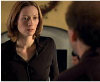
2002 ADAPTATION (Adaptation) de Spike Jonze avec Nicolas Cage