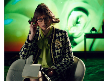
2014 ZERO THEOREM (Zero Theorem) de Terry Gilliam