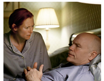
2008 BURN AFTER READING (Burn after reading) de Joel & Ethan Coen avec John Malkovich